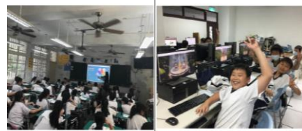
介紹網站：104 工作世界